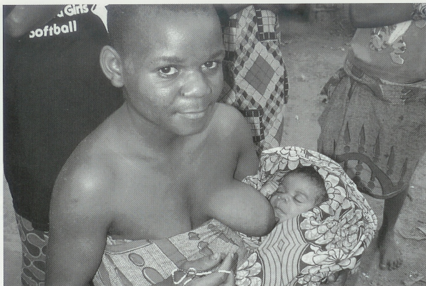
In de kraamkliniek worden Pygmeeën niet meer gratis behandeld

Twee dagen later kwamen we aan in Kommanda. Dat is de plaats waar we vijftien jaar geleden zijn gestart. Daar hebben we het ziekenhuis bezocht dat we voor de pygmeeën hebben opgezet. We wisten dat het ziekenhuis in 2002 door rebelligroepen uit Bunia (uit het gebied van de Lendu en Hema) met mortieren was bestookt. Sinds die tijd hadden we geen informatie meer. Toen we aankwamen, bleken de bomen uit de kraamkliniek te groeien. De daken waren zwartgeblakerd, in de muren zaten kogelgaten en kanonsgaten. Toch draaide de kliniek nog met geld van het Zwitserse Medair. Maar het gratis behandelen van